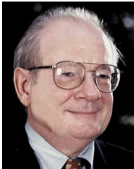
Raymond A. Moody

Das wohl wichtigste Element einer Nahtoderfahrung kristallisiert sich meist jedoch erst